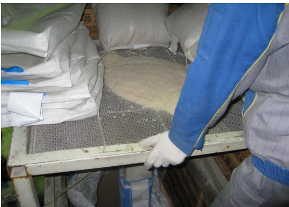
MA米カビ選別フルイ 使用例